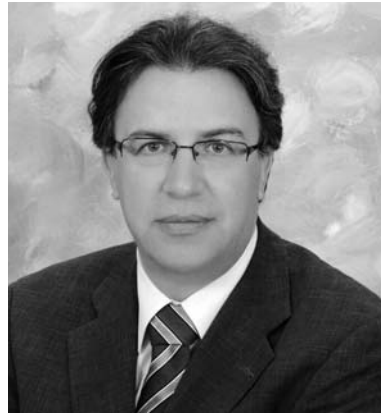
Ευάγγελος Ζερβέας Συνήγορος του Καταναλωτή

Στην εκδήλωση κατετέθησαν σημαντικές προτάσεις, αποκαλύψεις προβληματισμοί, που ανέδειξαν το πόσο ευάλωτοι είμαστε, θεσμικά και τεχνολογικά, έτσι ώστε συγκεκριμένες νομοθετικές αλλαγές και αλλαγές νοοτροπιών και αντιλήψεων, να είναι επιτακτικές και αναγκαίες.