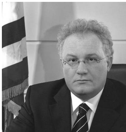
ΙΩΑΝΝΗΣ ΑΔΑΜΟΠΟΥΛΟΣ Τ. ΣΥΝΗΓΟΡΟΣ ΤΟΥ ΚΑΤΑΝΑΛΩΤΗ

Κυρίες και κύριοι, το ηλεκτρονικό εμπόριο (e-commerce) είναι πλέον η νέα πραγματικότητα, τόσο για τους καταναλωτές που αναζη-